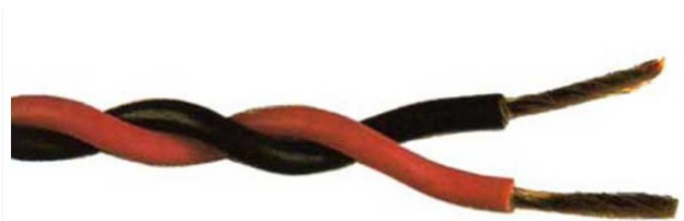
Ilustración 2: Ejemplo de trenzado de conductores