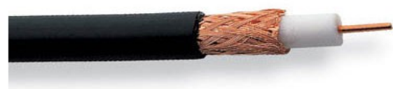
Ilustración 3: Ejemplo de cable coaxial