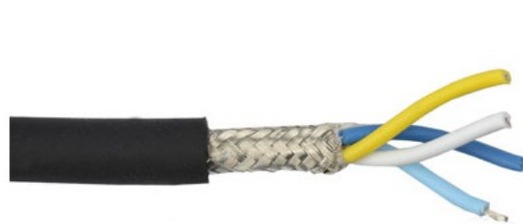
Ilustración 4: Dos pares de conductores trenzados con malla.

A partir de esta composición, según los materiales con los que estén fabricados estos componentes, se otorga al cable unas propiedades físicas características.